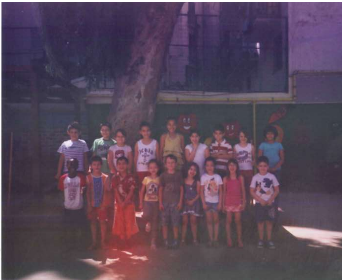
Οι μαθητές και οι μαθήτριες του Α'1 στο προαύλιο του σχολείου τους