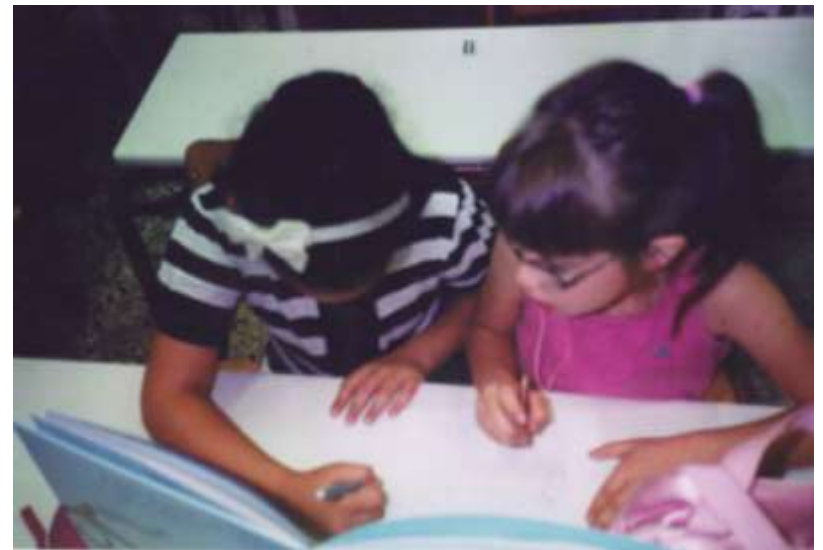
Τα παιδιά της Πρώτης Τάξης ενώ συνεργάζονται σε Δυάδες